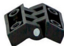
20300090 Dobradiça plástica tampa superior