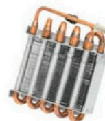
20300093 Condensador 50w Serraff s/ventilador