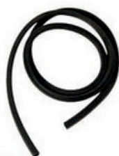
20300099 Perfil esponjoso 7x7mm