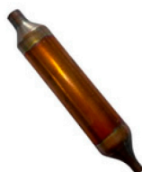
20300095 1/4" Filtro Secador