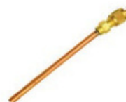
20300073 Válvula Scharader 1/4" x 50 mm