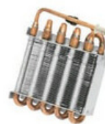
20300093 Condensador 50w Serraff s/ventilador