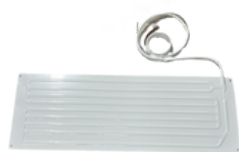
20300237 Evaporadora placa 220x605mm