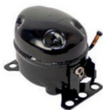
20300129 Compressor Maxiclíma