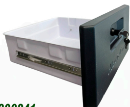
20300241 CJ MTG Porta Uni 21L Bandeja