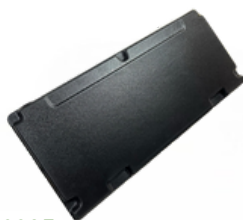
20300235 Porta Tras. NTG P-G