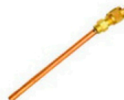
20300073 Válvula Scharader 1/4" x 50 mm