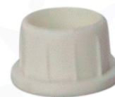
20300142 Tampão plástico pás injeção