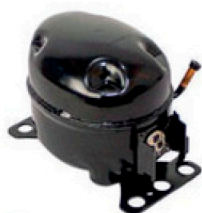
20300129 Compressor Maxi clima