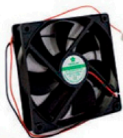
20300094 Microventilador Fan 12V 120 x 120 x 25mm