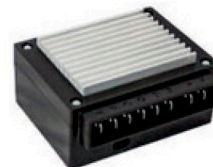
20300128 Unidade eletrônica Maxi clima 2.6