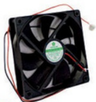
20300094 Microventilador Fan 12V 120 x 120 x 25mm