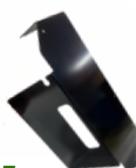
20300237 Revestimento compressor NTG P-G