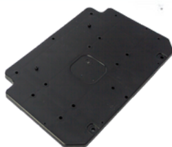
20300105 Base do Compressor