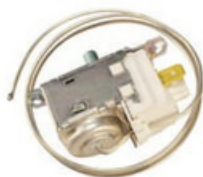
20300123 Termostato universal refrigerador