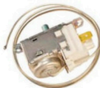
20300123 Termostato universal refrigerador