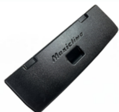
20300236 Porta Diant Actros NTG P-G