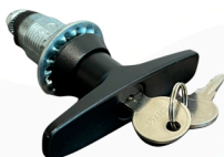
20300243 Trinco fechadura compressão