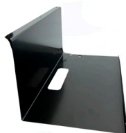
20300242 Chapa Met. Aco fechamento