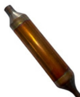
20300095 1/4" Filtro Secador