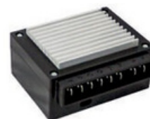
20300128 Unidade eletrônica Maxiclíma 2.6