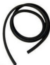
20300099 Perfil esponjoso 7x7mm